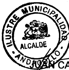
JUAN CARLOS ALFARO ARAVENA ALCALDE I. MUNICIPALIDAD DE ANDACOLLO